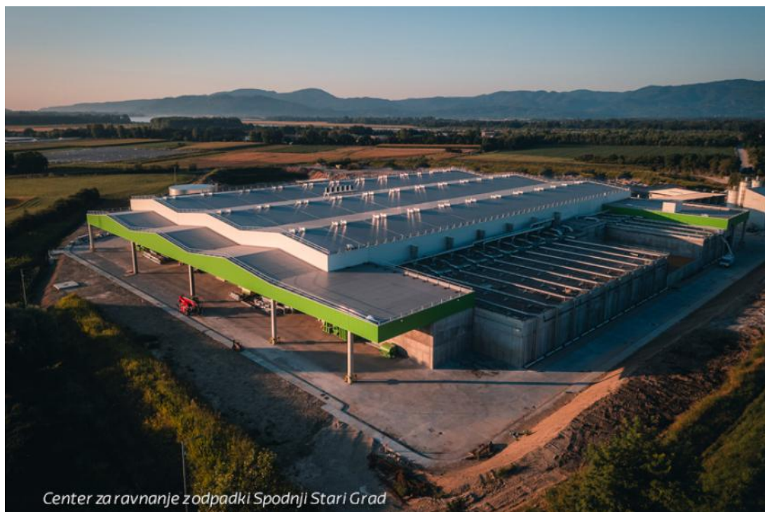
Slika 1: Center za ravnanje z odpadki Spodnji Stari Grad, Krško (novozgrajeni proizvodni objekt)

Na CRO SSG se bodo odpadki najprej mehansko in biološko obdelali, nato se bodo obdelani odpadki, ki imajo še uporabno vrednost oddali v dokončno obdelavo, del odpadkov, ki nima uporabne vrednosti pa se bo oddalo podizvajalcu na odlaganje, ki upravlja z odlagališčem za nenevarne odpadke v skladu s predpisom, ki ureja odlagališče odpadkov.